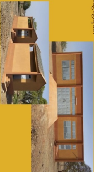
Ouverture de la première classe en octobre 2020

Un bâtiment de 4 salles de classe, un atelier génie civil/ bâtiment, un module administratif et 3 blocs toilettes, équipement en mobilier et matériel pédagogique.