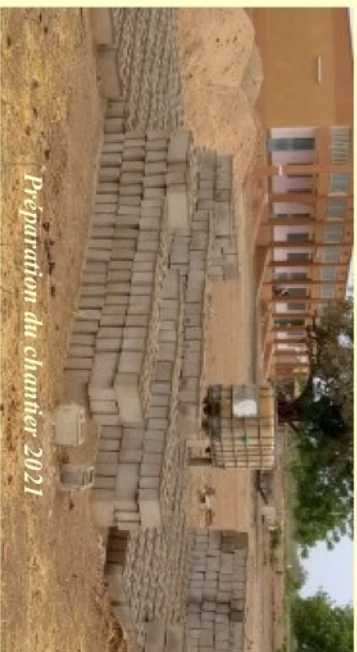
Préparation du chantier 2021

A la rentrée 2021, ouverture d'une classe CAP génie civil section électricité et une classe BEP section comptabilité, gestion et administration commerciale.