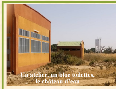
Un atelier, un bloc toilettes, le château d'eau