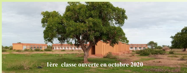
1ère classe ouverte en octobre 2020

Un bâtiment de 4 salles de classe, un atelier génie civil/ bâtiment, un bâtiment administratif et 5 blocs toilettes, un forage avec château d'eau et bornes fontaines, équipement en mobilier et matériel pédagogique.